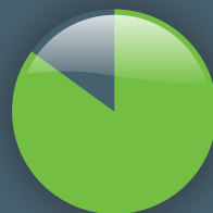
Par mode d'admission en 2013